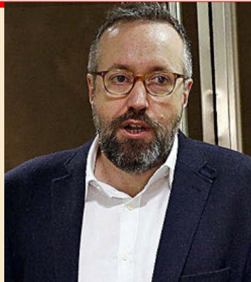
El portavoz de Ciudadanos Juan Carlos Girauta se incorporó como socio en Cremades.