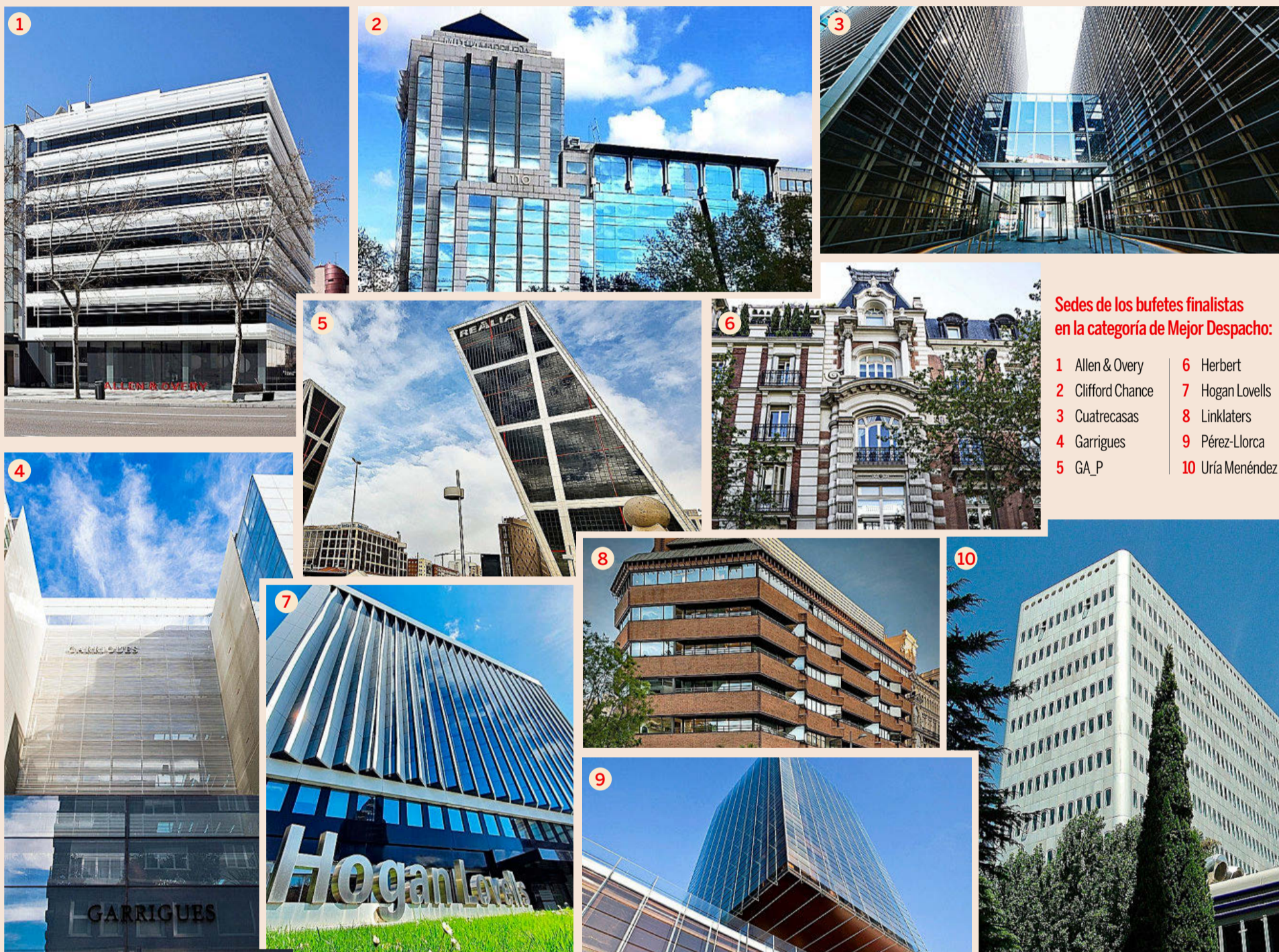
Sedes de los bufetes finalistas en la categoría de Mejor Despacho: