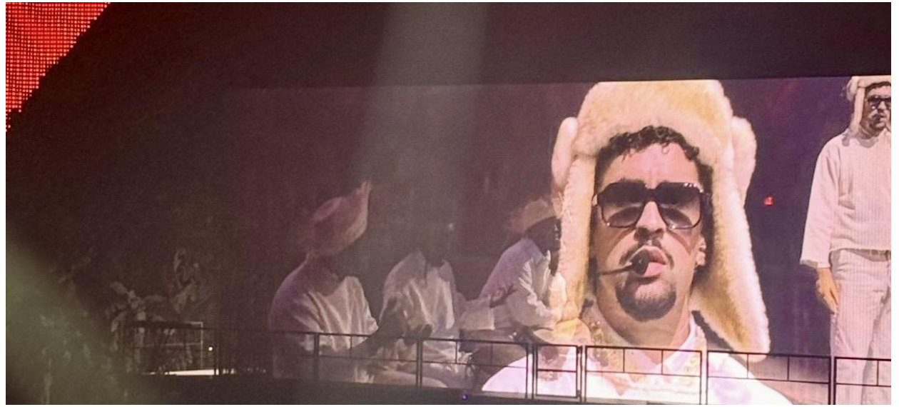
La música siempre encuentra la forma de conectar con algo dentro de nosotros | Concierto Bad

Porque, al final, gran parte de su propia historia también ha estado marcada por eso: aprender a confiar en sí misma, encontrar su voz y construir una vida mucho más alineada con quien realmente quiere ser.