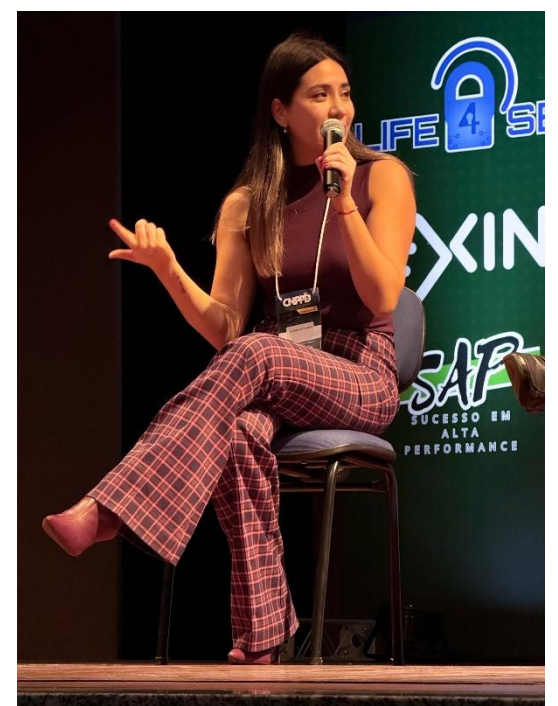
Exponiendo en materia de Protección de Datos | São Paulo, Brasil.

Por eso, hoy apuesta por construir equipos donde las personas puedan crecer, equivocarse, aprender y sentirse valoradas.