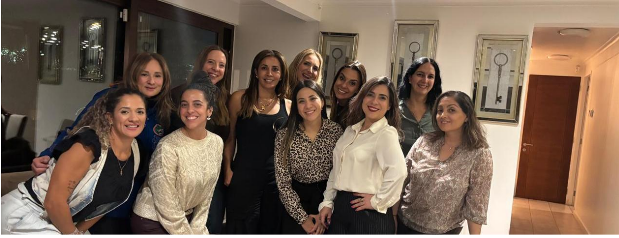
Cóctel de camaradería de mujeres | Protección de Datos REDIAAC