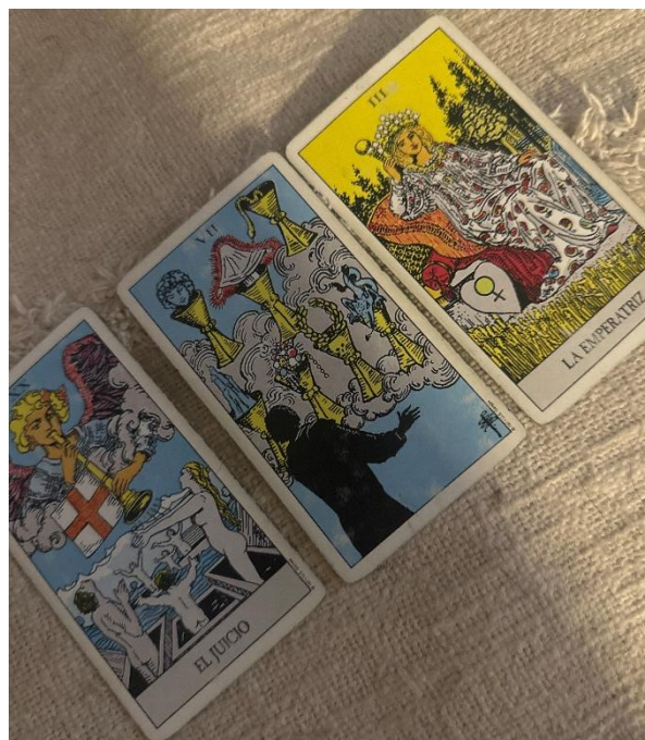
Intuición, crecimiento y autenticidad

“Hay veces en que algo simplemente no se siente correcto. Y ahí es donde uno vuelve a mirar todo de nuevo.”