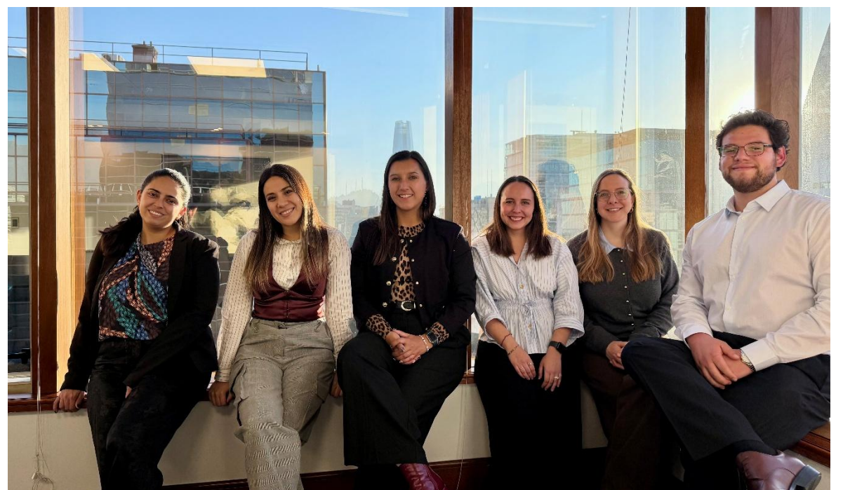
Rodearse de personas que inspiran también es parte del camino | Equipo de Protección de datos

Atraverse nunca ha significado no tener miedo. Significa avanzar incluso con incertidumbre, confiando en que cada experiencia, incluso las que no resultan como esperabas termina dejando aprendizaje, fuerza y nuevas herramientas para el futuro.