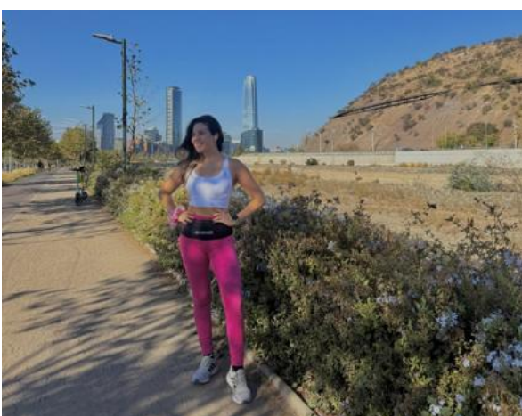
Trotando por la Costanera | Santiago

“Antes confundía la intuición con miedo. Hoy aprendí que cuando algo no me hace sentido, mi cuerpo me lo dice antes que mi cabeza.”