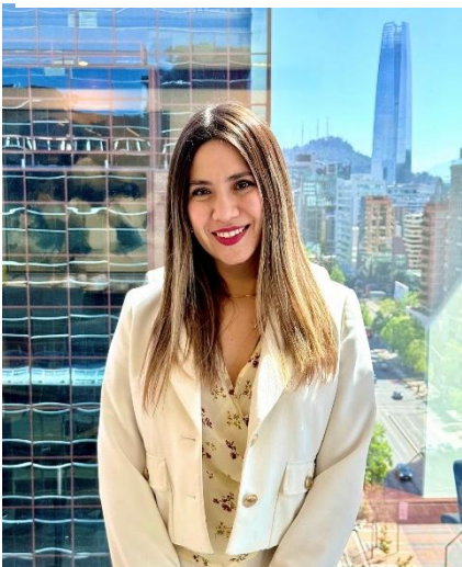
Bienvenida a ECIJA Chile

“ECIJA significó un nuevo comienzo. Sentí que podía volver a ser yo.”