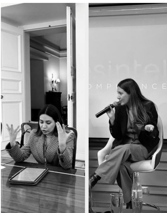
Comisión de Implementación de la Ley de Protección de Datos Personales | Palacios de La Moneda.

Lo que comenzó como curiosidad terminó transformándose en una especialización en el área donde encontró su lugar profesional.